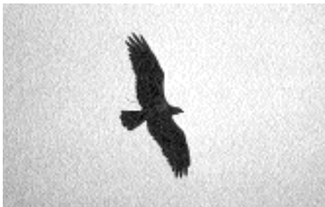
Fiskgjusen är en av Sveriges största rovfåglar. Den kan ha ett vingspann på upp till 170 centimeter.

Fiskgjusen häckar över hela Sverige utom på Gotland. Tätheten varierar från hög i slättbygderna söderöver, till låg i fjällnära områden, främst beroende på fisktillgång och förekomst av lämpliga botråd. Det stora boet byggs av grenar och fodras med jordklumpar, gräs, mossa och lavar. Det är viktigt för fiskgjusen att ha gott om utrymme för inflygning från alla väderstreck,