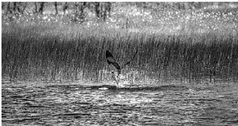
Även om antalet har minskat finns det fortfarande gott om fiskgjusar i Färnebofjärdens nationalpark. Fiskgjusen är den rovfågel som är mest specialiserad på att fånga och äta fisk.

Telefon 0291-205 77. Se även www.sandviken.se/mygg