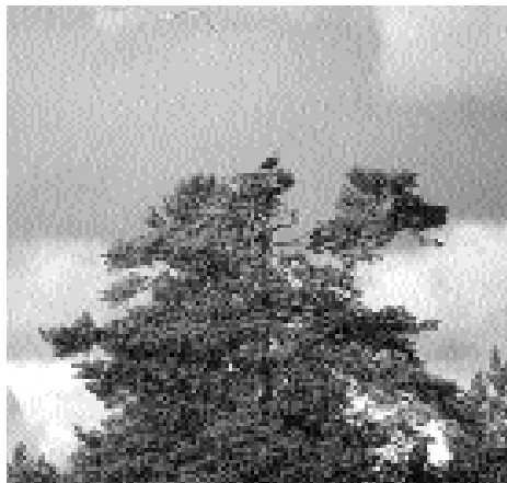
I toppen av ett stort och kraftigt träd bygger fiskgjusen sitt bo. Den sist kvarvarande ungen väntar på höstflyttningen i början av september.

Mot slutet av juli är det dags för ungas första flygtur. Den föregås av 1-2 veckors intensiv flygträning, då ungarna flaxar vildsint i