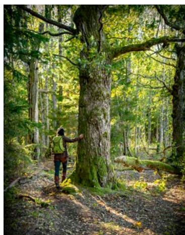
2:a plats. "Skogstankar"