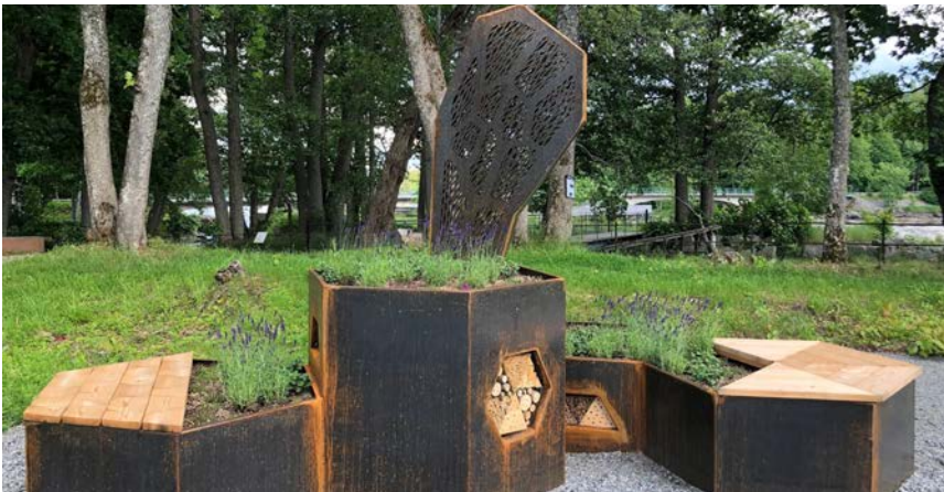
Här kan du dofta på blommorna eller bara koppla av en stund. Nectar Lounge är designad av konstnären Johanna Strand.

Ett stort varmt tack till alla besökare som kom och förgyllde firandet av världsmiljödagen och invigningen av Nectar Lounge!