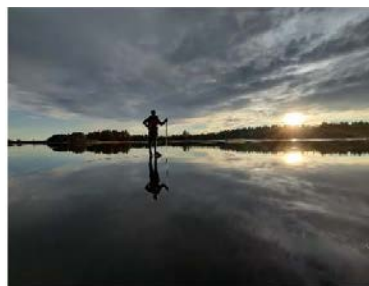
3:e plats. "Spegelis på Färnebofjärdens"