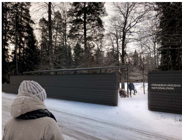
Ingången huvudentrén. Fotomontage: White Arkitekter

Arbetet med våra nya entréer i parken kommer ta lite tid. Vi hoppas att ni kan ha tålamod med detta.