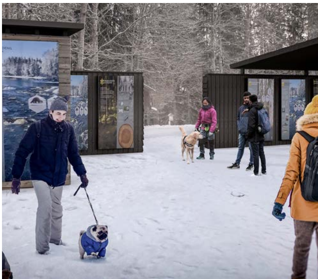
Skiss från huvudentrén. Fotomontage: White Arkitekter

Sevedskvarn, Skekarsbo, Öberget och Balforsens entréer är slitna och behöver ses över för att möta det ökade besöksstrycket i parken. Tanken är att den finaste naturen i Färnebofjärdens nationalpark även ska avspeglas i entréområdena. Planerad byggstart är sommaren 2022 och målet är att entréerna ska stå färdiga inför sommarsäsongen 2023.