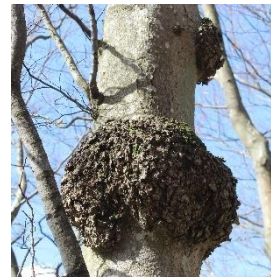
Ett ovanligt format träd