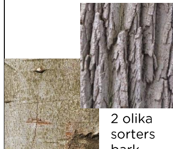
2 olika sorters bark