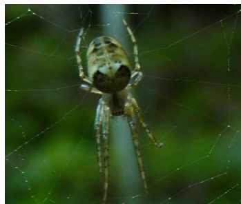
En stor spindel