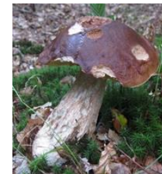
En svamp med gnagspår