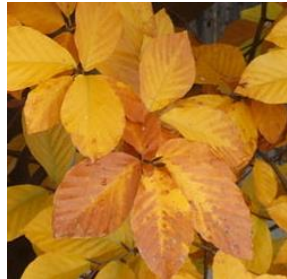
Ett tvåfärgat löv