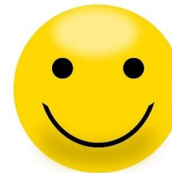
Något du tycker om