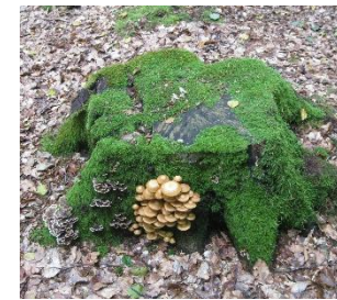
En stubbe att sitta på