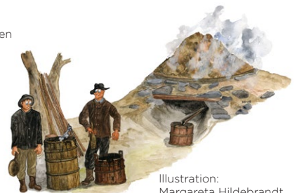
Illustration: Margareta Hildebrandt

Teerbrennen war für die Menschen in der Tiveden-Gegend ab dem 17. Jahrhundert und weit bis ins 19. Jahrhundert eine wichtige Einkommensquelle. Der Teer wurde aus harzreichem Kiefernholz gewonnen, das langsam in einem Teertal verbrannt wurde. Das Teertal konnte bis zu 10 m lang und 1 m breit sein.