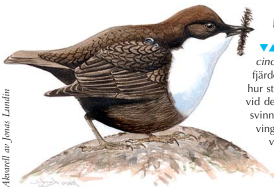
Illustration av Jonas Lundin

▼ Mer information? Vill du veta mer, besök gärna projektets hemsida via www.x.lst.se .