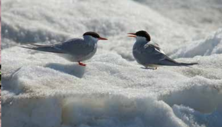
Silvertärnorna kommer åter från Antarktis i mitten av maj och landar på isen utanför Sandskär.