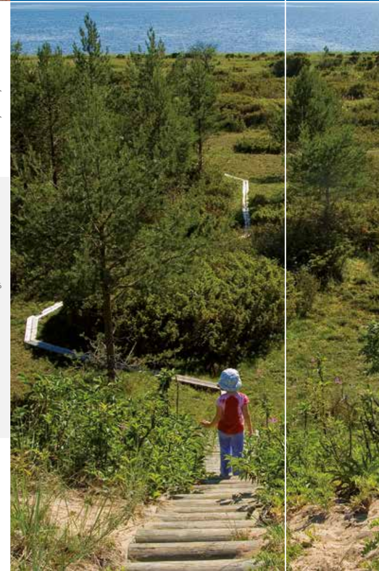
Text och foto: Thomas Öberg, Natur i Norr • Grafisk form: Armada Reklambyrå • Tryckår 2018.