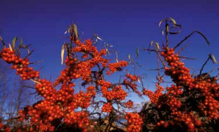
Havtorn med sina C-vitaminrika bär växer längs öns stränder.