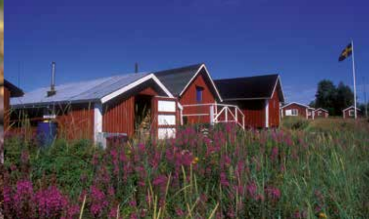
Fiskarstugor vid Kumpula, det gamla fiskeläget vid båthamnen.